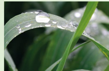
Dernière feuille déterminant le rendement, traitée avec Elatus Era