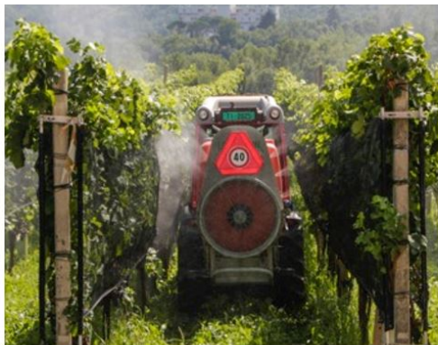
Beide Düsentypen zeigen einen hohen Bedeckungsgrad

Antidrift Düsen = reduziertes Driftpotential