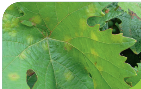
Falscher Mehltau ( Plasmopara viticola )

Achten Sie beim Schnitt auf die Holzqualität. Eine Austriebsbehandlung mit Thiovit Jet ab 15°C ist eine günstige und wichtige hygienische Massnahme bei der Mehltaubekämpfung. Ausserdem werden auch die Kräusel- und Pockenmilben miterfasst. Mit Taegro bieten wir eine neue rückstandsfreie Abschlussbehandlung gegen Echten Mehltau an.