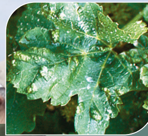
Kräusel- und Pockenmilbe

Achten Sie auf eine rechtzeitige Applikation und gute Abwechslung der Fungizide mit unterschiedlichen Wirkstoffgruppen. Wichtig ist auch ein frühzeitiger Einsatz (Spritzstart) von Auralis, um die rebeigenen Abwehrmechanismen zu aktivieren. Auralis kann auch zum Abschluss mit Cuprofix Fluid eingesetzt werden.