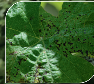
Schwarzfleckenkrankheit ( Phomopsis viticola )