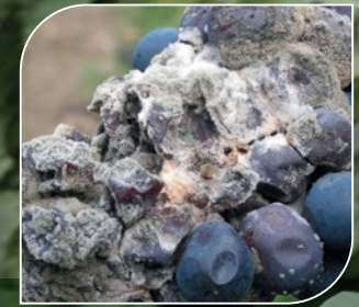
Rosafäule ( Trichothecium roseum )