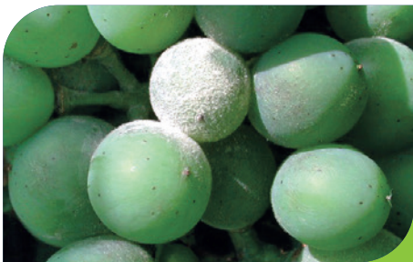
Echter Mehltau ( Erysiphe necator )

Ab Entwicklung der Blütenanlage bis zum Fruchtsatz ist die Rebe sehr empfindlich gegenüber falsche Mehltauinfektionen. In diesem Stadium ist die Traube sehr empfindlich und speziell das Abfallen der Kappen dient als Eintrittspforte für Mehltausporen. Nicht bekämpfte Infektionen während dieser Zeit können erhebliche Ernteverluste verursachen.