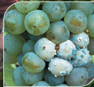
Grünfäule ( Penicillium expansum )

Ein einwandfreier Schutz ist unerlässlich. Systemische Fungizide und angepasste Intervalle sind oberste Priorität.