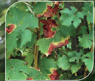
Roter Brenner ( Pseudopeziza tracheiphila )