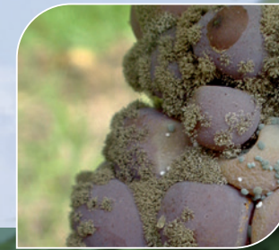
Grauschimmel ( Botrytis cinerea )