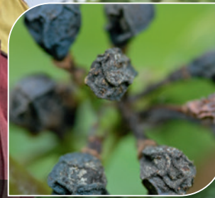
Schwarzfäule-Beerenbefall ( Guignardia bidwellii )