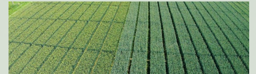
Syngenta Versuchsfeld in Dielsdorf ZH

Parzellenversuch in Dielsdorf ZH auf Winterweizen Arina: Einmalige Behandlung mit einem Fungizid im Fahnenblatt-Stadium mit Bonitierung auf Braunrost und Ernteerhebung. Elatus Era zeigte die beste Wirkung gegen Braunrost und generierte zudem am meisten Ertrag. Die exzellente Wirkung auf Rostkrankheiten und Septoria wurde in weiteren hunderten von Versuchen europaweit bestätigt.